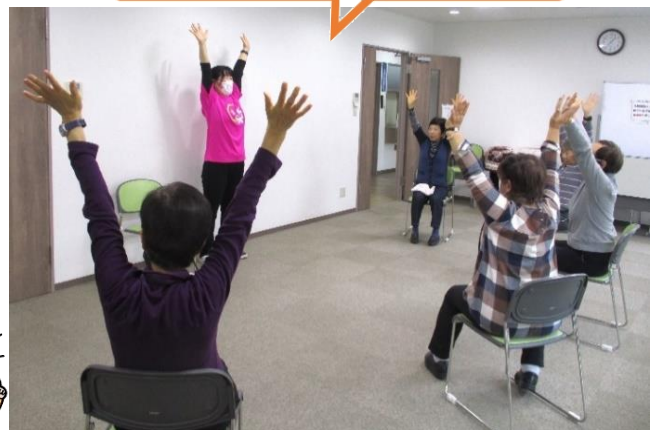
《協賛》屏風ヶ浦地域ケアプラザ